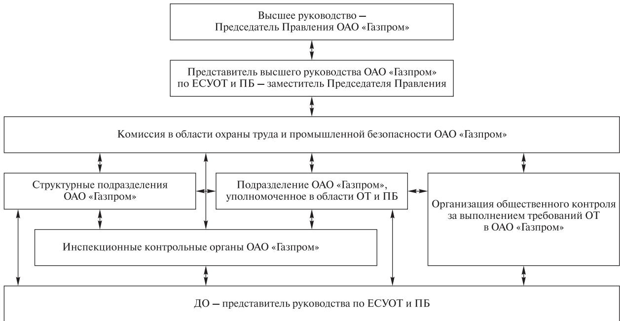
Схема структуры Единой системы управления охраной труда и промышленной безопасностью в ОАО «Газпром»